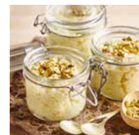
Dessert de riz à la pistache page 32