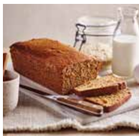
Pain d'épices page 10