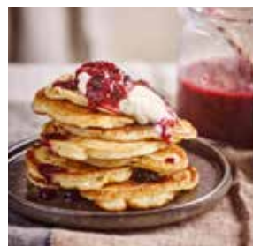
Pancakes au kéfir page 14