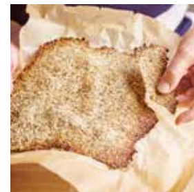
Crackers aux graines page 24