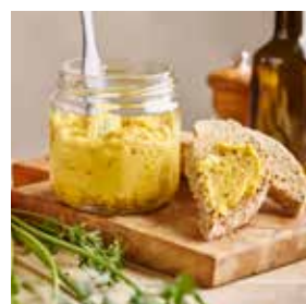
Dip carotte-gingembre page 28