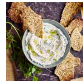
Dip de ricotta aux herbes fraîches page 26