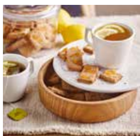
Biscuits au gingembre page 16