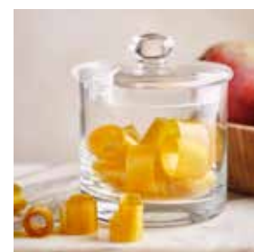
Bonbons à la mangue page 30