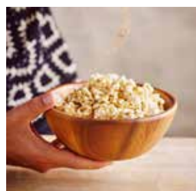
Popcorn sucré gingembre-cannelle page 20