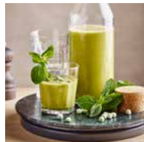
Soupe froide aux petits pois et menthe page 22