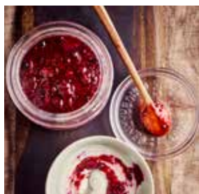
Compote de fruits rouges page 12