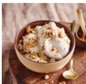
Nice cream à la banane page 18